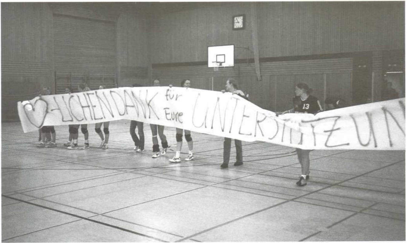
Damen 1 – bedankt sich bei den Zuschauern zum Saisonabschluss 2002/2003