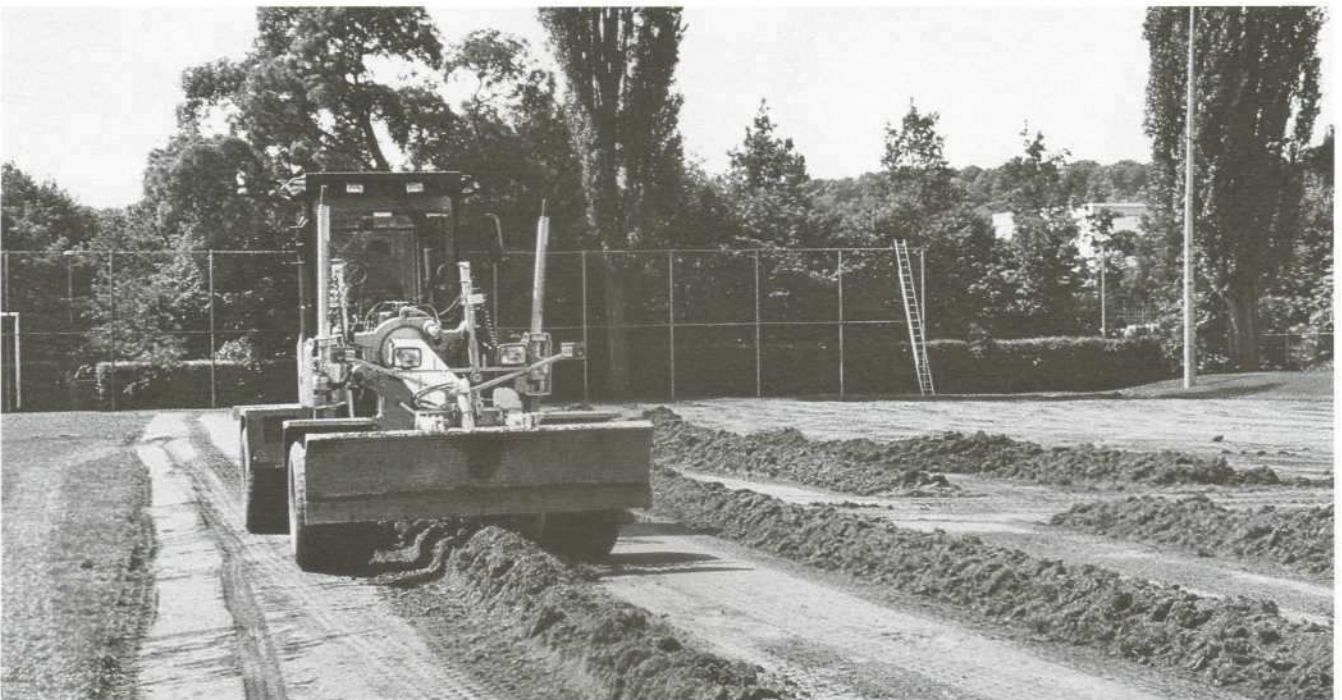
Abschieben der Grasnarbe auf Platz 2.

Bei den vorhandenen 2 Rasenplätzen war das aufgrund der sich immer mehr verändernden klimatischen Verhältnisse oft nicht mehr zu realisieren mit den sich daraus ergebenden Problemen: Spielverlegungen, kein Training, Verärgerungen – einfach Frust.