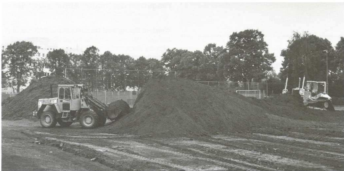
Die Humuserde liegt für den Abtransport bereit.

Zu den Sanierungsmaßnahmen gehören noch die Verbesserung des Flutlichtes, neue Ballfangzäune, Einbauten (Bodenhülsen, Tore, Markierungen) und notwendige Maßnahmen an der Beregnung und Entwässerung.