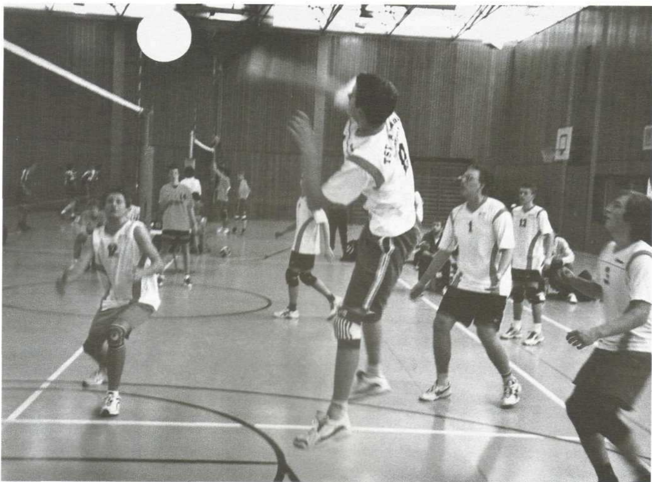
Allianz A-Jugend – beim Angriff am Netz