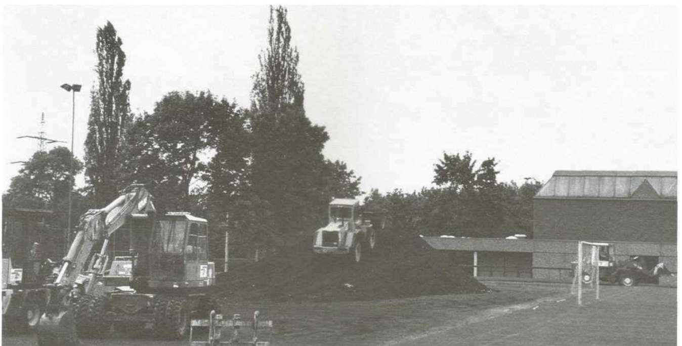
Die Arbeiten haben begonnen – die Aschenbahn wird abgetragen.

Auf Platz 3 (in Verlängerung der Halle) entsteht eine Beachvolleyballanlage mit drei wettkampfgerechten Spielfeldern. Damit wird der große Wunsch der Volleyballabteilung (eine der mitgliederstärksten Abteilungen in unserem Verein) erfüllt und der Verein kann eine neue, sehr attraktive Sportmöglichkeit anbieten.