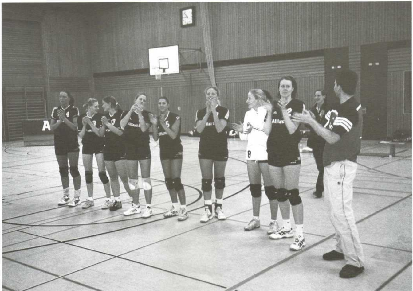
Damen 1 – nach längerer Durststrecke wieder ein Sieg gegen Sinsheim 3:1, am 22.3.03