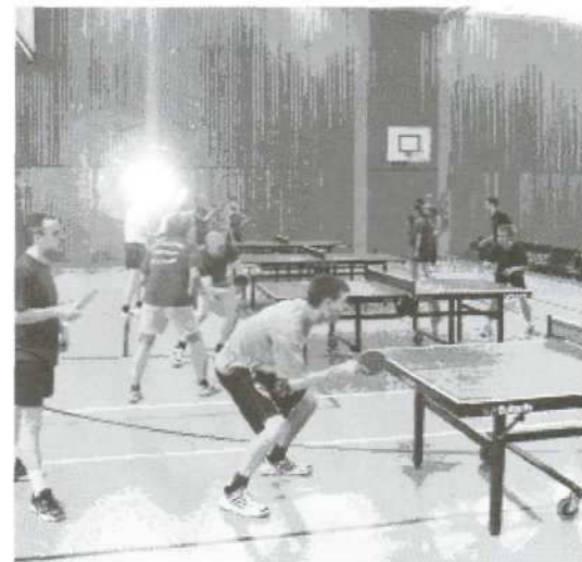
Volles Haus in der Alli-Halle bei der Doppel-Vorrunde