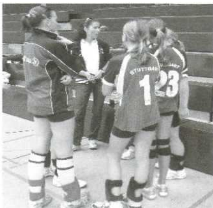
Schüler mit Lehrerin

Um solche Trainingsumfänge zu fahren, bedarf es natürlich einer engen Kooperation mit einer Schule, damit diese nicht zu kurz kommt. Hier haben wir als Partner das Schickhardt-Gymnasium Stuttgart gewinnen können. Das Schickhardt-Gymnasium ist eine Eliteschule des Sports und gehört zum Schulverbund des Olympiastützpunktes Stuttgart. Auf diese Schule gehen im Moment acht Mädchen in drei Klassen, denen es dort möglich ist auch am Vormittag zu trainieren. Nachmittags gehen die Mädchen in einen Zusatzunterricht und danach kom-